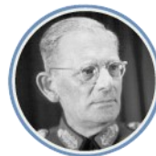
Максимиллиан фон Вайкс, Командующий группой армий «В»