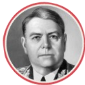
Александр Василевский, Представитель Ставки Верховного Главного командования