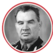
Василий Чуйков, Командующий 62-ой армией