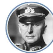
Эрих фон Манштейн, Командующий группой армий «Дон»