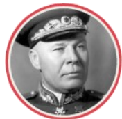
Семен Тимошенко, Командующий Сталинградским фронтом