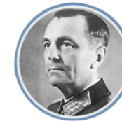
Фридрих Паулюс, Командующий 6-й армией Вермахта

Продолжительность ..... 200 дней и ночей Территория, охваченная сражением ..... около 100 тыс. кв. км Протяженность фронта ..... от 400 до 850 км (территории современных Воронежской, Ростовской, Волгоградской областей и Республики Калмыкия)